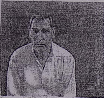
पट्टा देने वाला

Reg. No. 401 Reg. Year 2007-2008 Book No. 1